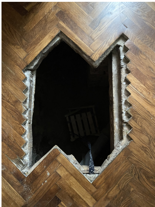
1. Zachowane wejście do kryjówki w domu prywatnym w Żółtkwi, Ukraina