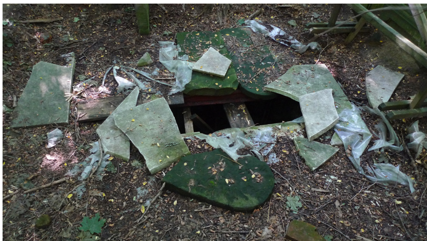
3. Kryjówka w kwaterze 41, cmentarz żydowski przy ul. Okopowej, Warszawa