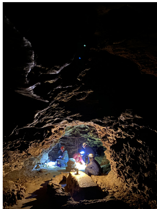
4. Odpoczynek podczas badań w jaskini Ożerna, Ukraina